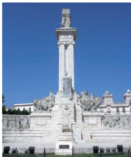
Monumento a las Cortes de 1812, Cádiz.

proyecto revolucionario. Aun así, su escasa resistencia activa a la gran reforma constitucional aún asombra a los historiadores: apenas una docena de diputados realistas participaron de forma notable en los debates del texto.