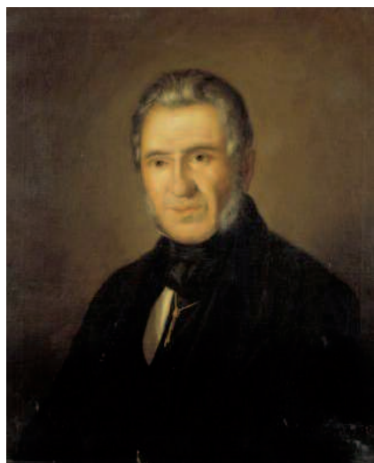
Agustín Argüelles, diputado liberal en las Cortes de Cádiz.

Las críticas de Jovellanos al Contrato Social de Rousseau, a las que se sumarían otros pensadores menos con-