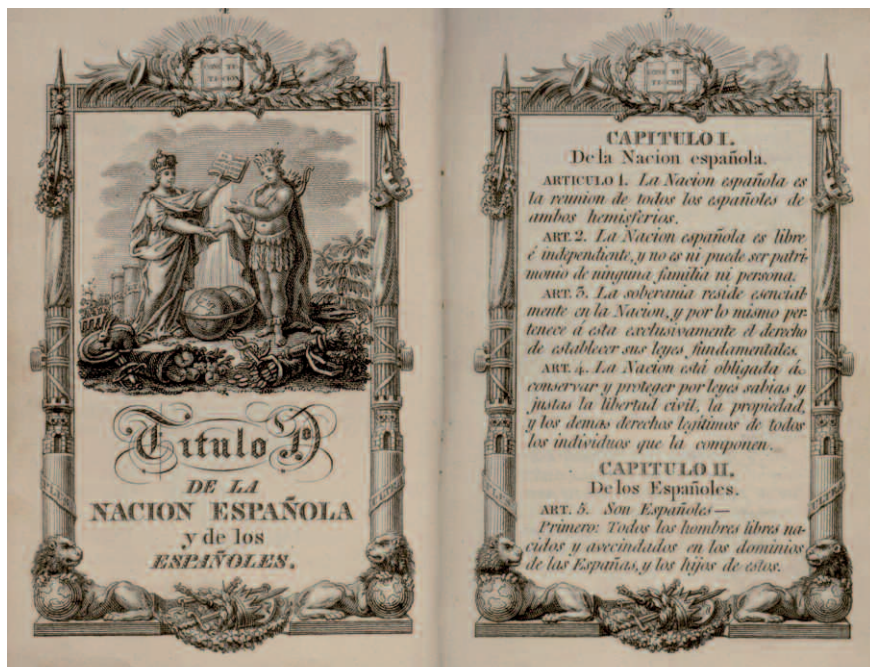
Primeras páginas y artículos de la Constitución de 1812.

hasta definir la soberanía política del Estado por principio de elevación. En este sentido, la sociedad no se entendía como un agregado de individuos dispuestos únicamente por su libre voluntad, sino como resultado de una unidad orgánica inherente a la dimensión social de la persona, ordenada a una superior convivencia por la que debería velar la ley civil.