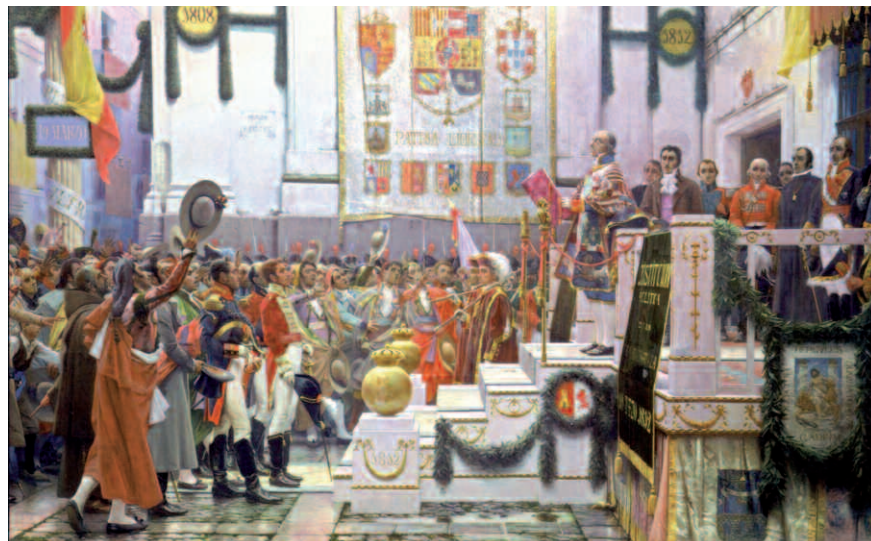
Proclamación de la Constitución, pintado por Salvador Viniegra y Lasso de la Vega.

¿A que fue debida esa situación? Con la Constitución y las Cortes dominadas, los liberales se sintieron seguros, gobernaron como una Asamblea y, en ausencia del rey, asumieron los po-