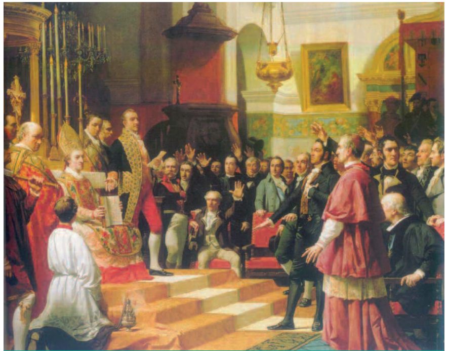
Jura de los diputados de las Cortes de 1810, obra de Casado del Alisal.