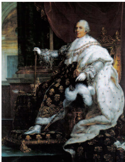
Luis XVIII de Francia abogó siempre porque Fernando VII aceptara una Carta Otorgada.

emulaban a las españolas. No obstante podemos ver, a diferencia del texto gaditano, una declaración explícita de derechos y deberes del ciudadano, ejemplo de la influencia francesa. En muchos puntos el sustrato seguía siendo, de cualquier modo, francés e incluso inglés. La Constitución portuguesa era por tanto la síntesis perfecta de los elementos gaditanos con los galos, sin que deba esto llevarnos a pensar que la Constitución portuguesa no incluía ninguna novedad. Destacamos, por ejemplo, la tolerancia mostrada en cuanto a la religión. Pero la opinión común europea era que tanto la Constitución española como la portuguesa estaban auspiciadas por las mismas sociedades secretas.