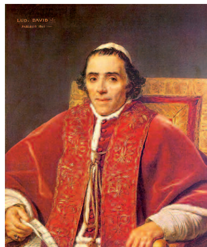
El papa Pío VII fue secuestrado por orden de Napoleón en 1808.

alto coste político y humano para el cardenal, que fue muy criticado por cabildos, obispos y curas párrocos. A pesar de la prohibición del Gobierno, Gravina, desde su exilio portugués, continuó manteniendo correspondencia con obispos y despachando dispensas apostólicas como hasta entonces. También contactó con el grupo de obispos exiliados en Portugal con vistas a formar un conjunto opositor al régimen liberal. Meses después, el perseverante nuncio publicó un manifiesto con su versión de los hechos –que circuló en España de forma encubierta– y en el que, sin citarlo abiertamente, marcó al cardenal Borbón como uno de los principales garantes de las adversidades de la Iglesia española. La salida del nuncio y la elección de una nueva Regencia más permeable a los deseos de las Cortes hizo creer a los partidarios de una Iglesia Nacional que había llegado el momento de hacer realidad sus viejos sueños. A mediados de marzo de 1813, se supo en Cádiz, a través de la prensa británica, que Napoleón y el Papa habían firmado un nuevo Concordato, reverdecido así el ya lejano de 1801. El acuerdo, que había sido una enajenación forzada de la que Pío VII se retractaría dos meses después, aunque esto no se supo, fue publicado por el César corso en todos sus territorios con la mayor solemnidad. El Concordato en sí otorgaba a Napoleón, entre otros, el derecho de nombrar obispos de su Imperio, lo que daría al Emperador un total control sobre el episcopado, legalizando la situación de obispos