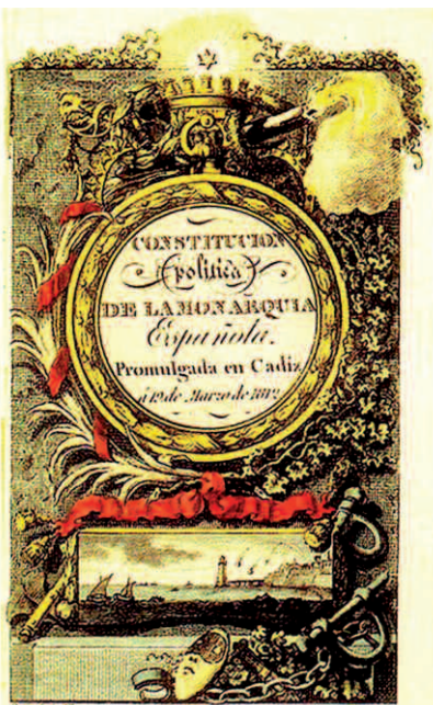
Portada de la Constitución de 1812,

En la Junta Suprema Central se confinaron algunas de las cabezas más brillantes de la política española de entonces. Entre ellas estaba Jovellanos, que fue elegido junto con otros cuatro vocales más para preparar el reglamento. En consonancia con su cometido, el 7 de octubre de 1808 informó en una sesión nocturna que la Junta Suprema Central estaba legitimada a rebelarse contra la invasión francesa, empero sus funciones debían regirse bajo el derecho español y, por consiguiente, su función debía ser convocar unas Cortes que eligiesen una Regencia durante el