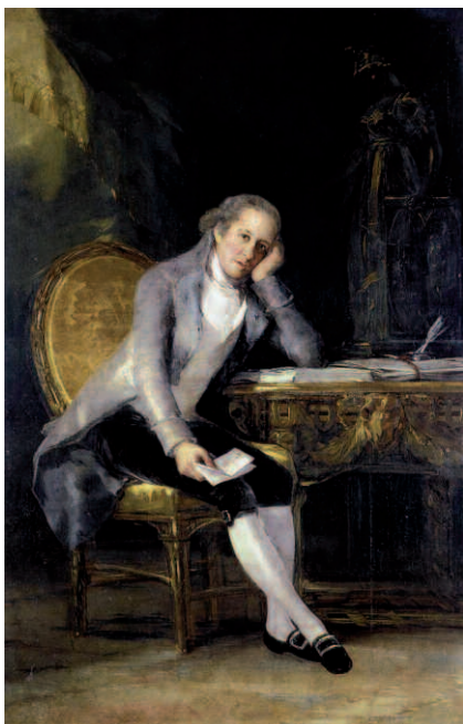
Retrato de Melchor Gaspar de Jovellanos, por Goya.

Esta conciencia acerca de la existencia y valor de las leyes antiguas de la Corona quedaría bien patente a lo largo de sus varias ediciones, que concluirían con la Novísima Recopilación de las Leyes de España ordenada por Carlos IV en 1805. De ahí que para Jovellanos y otros juristas de la época, la Constitución española fuera ya efectiva y viniera dada por un lento y prolongado proceso histórico que habría conformado la conciencia nacional. Por eso la refundición de las Leyes Fundamentales fue contemplada como una posibilidad reformista, enfocada a su mejora, siempre que salvara la esencia de su contenido en cuanto medio al servicio del bien común. Un planteamiento que hundía sus raíces en el concepto realista de naturaleza desarrollado por la escolástica medieval y que continuaría la Escuela de Salamanca del siglo XVI en sus consideraciones filosóficas referentes a la ley y a su aplicación por parte de los poderes públicos. Según esa visión antropológica, el hombre como ser social vendría a realizarse en el ámbito de sus propias entidades naturales