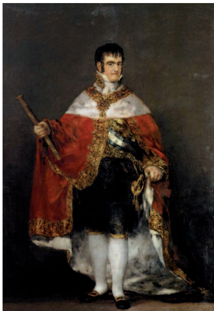
Retrato de Fernando VII, por Goya. El rey, antes de su encuentro con Napoleón en 1808, había firmado la orden de convocar Cortes en su ausencia forzada.

afirmada en buenas leyes. Empeñemos por este medio a la clase instruida y que debe ser la moderadora de la opinión pública, a fortificarnos con su adhesión y a derramar en el espíritu nacional el fuego, el ardor y la vida que sólo pueden derivar de sus escritos y de sus discursos; trabajemos, en fin, por este medio aquel robustecimiento que todavía falta a la autoridad de la Junta Central, trayendo a su apoyo todas las clases del Estado y la voluntad general.»