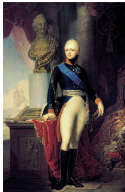
Retrato del zar Alejandro I Romanov.

No faltaron, sin embargo, liberales franceses que quisieron ver en la Constitución de Cádiz una imagen mucho más amable, pero incluso entre ellos estuvieron presentes las críticas al texto constitucional. Exigían más equilibrio entre el ejecutivo y la Cámara Popular, rechazaban el unicameralismo y se mostraban intransigentes con la intolerancia religiosa. En cualquier caso, la mayor parte de la intelectualidad