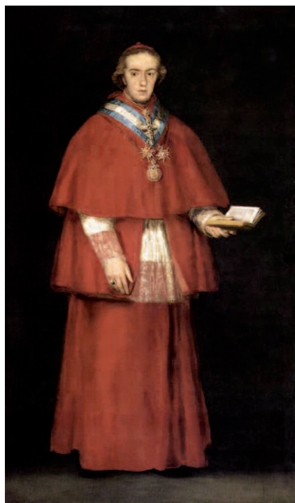
Retrato del cardenal Luis de Borbón, arzobispo de Toledo, primo de España y regente, por Goya (1800).

El artículo 12 de la Constitución proclamó la religión católica como la oficial del Estado, al tiempo que prohibía cualquier otra religión en los territorios peninsulares, insulares y ultramarinos de las Españas. Esta defensa, al tiempo que no fue del agrado de la Iglesia pese a que resultó contraria a lo defendido en el Concordato francés de 1801, no obvió que lo legislado en materia eclesiástica creara auténticas tensiones y finalmente rupturas. Por otra parte, para muchos de los sacerdotes ¿quiénes eran las Cortes para decidir cuál era la religión verdadera? El posicionamiento del clero en la guerra de la Independencia frente al invasor expli-