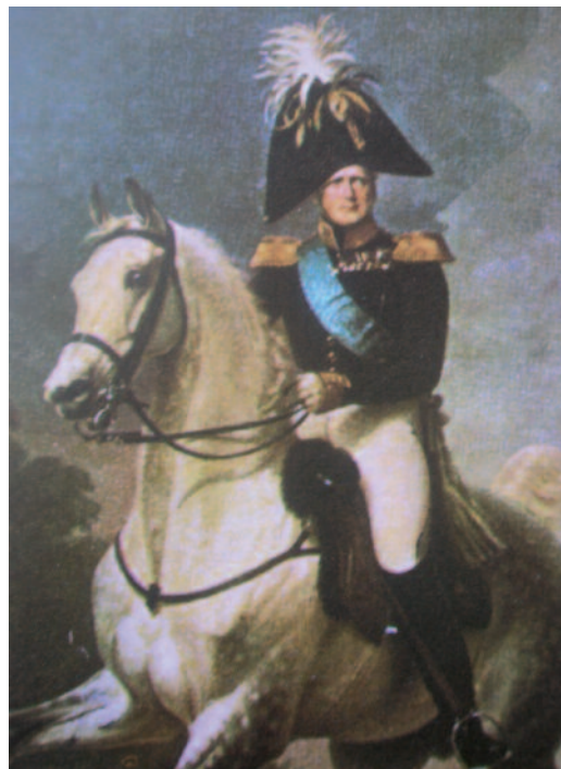
Retrato equestre del zar Alejandro I de Rusia. Escarmentado por su derrota en 1805, cuatro años más tarde no se atrevió a unirse a los austriacos en su nuevo enfrentamiento con Francia.

A los pocos meses, se anunció que la emperatriz estaba embarazada. Un año más tarde, el 20 de marzo de 1811, María Luisa dio a luz un varón. El hecho se anunció con gran solemnidad al pueblo y al Senado, mientras se hacían rogativas por el heredero al trono que recibió el título de rey de Roma en recuerdo de la tradición del Sacro Imperio Romano Germánico. Napoleón creyó que se encontraba en el cenit de su poder, y así era pero no advirtió que se trataba del comienzo del último acto del Imperio Napoleónico en Europa.