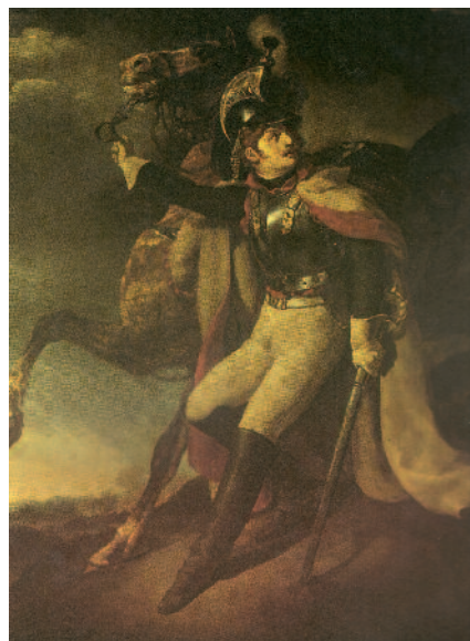
Coracero herido se retira de la batalla (1814) por Géricault. Esta vez, el pintor adivina el final del Imperio, simbolizándolo en este soldado de caballería francesa que, tras ser herido, decide alejarse con su caballo.

Al tomar el título de emperador, Napoleón reafirmó sus aspiraciones europeas de dominio, evocando a Carlomagno, que extendió su autoridad sobre Alemania e Italia, lo que le llevaría a enfrentarse a Gran Bretaña, Austria, Nápoles, Suecia y Rusia, que respondieron a las provocaciones francesas