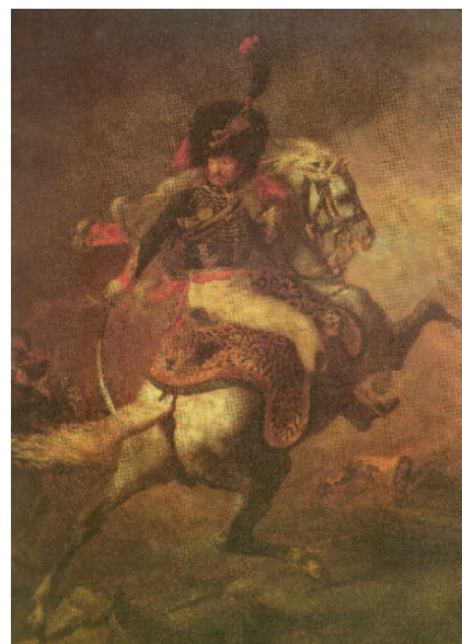
Oficial de cazadores de la Guardia Imperial (1812) por Géricault. El retrato de este militar simboliza el auge del Imperio napoleónico en Europa, labrado sobre sus victorias militares.

La Grande Armée –el Gran Ejército– que penetró en tierras rusas fue conocido como el ejército de las veinte naciones; de los 500.000 hombres que formaban la primera línea, apenas había 130.000 franceses, un factor que obstaculizó la coordinación y la comunicación entre unidades. Paralelamente, los generales europeos aprendieron a combatir a Napoleón. Poco a poco, abandonaron las estructuras lineales de combate y también atacaron los flancos o se atrincheraron en formación cuadrada para aguantar el empuje de la caballería ligera. Napoleón se vio obligado a hacer un derroche artillero y a lanzar impetuosos ataques que terminaban, generalmente, en una auténtica