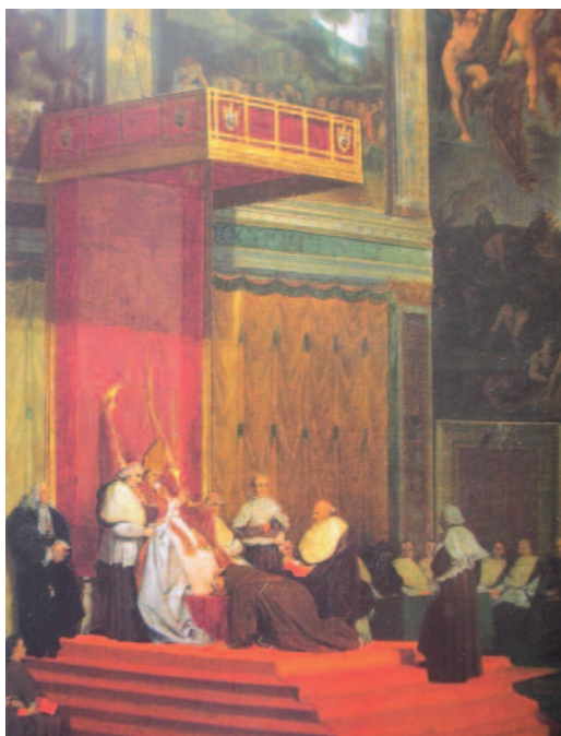
Pío VII con sus cardenales en una ceremonia en la capilla Sixtina, por Ingres.

Análogamente, Pío VII meditó, durante mucho tiempo, la utilización del arma más peligrosa y definitiva que se hallaba en sus manos contra Bonaparte: la excomunión. Finalmente, se decidió a ello y, pese a la vigilancia, algunos fieles servidores logran pasarle papel y tinta, algunas copias se difundieron por Francia, pero la policía pronto se apodera de ellas. El mundo eclesiástico, sin embargo, y la mayor parte de los laicos acabaron por conocer la existencia del documento y de su contenido general. Pero, ante el asombro del Pontífice, la opinión general se mostró indiferente. El clero francés incluso no reaccionó; los curas de Bretaña o de Flandes, que suprimieron el canto del Domine salvum fac imperatorem , constituyeron una excepción; el gran capellán continuó al servicio de la corte; los obispos, como antes, exaltaron las victorias y el genio de Su Majestad Imperial, guardando un discreto silencio sobre el asunto del Papa prisionero. Incluso algunos cardenales, apoyándose en una distinción de casuística, continuaron haciendo acto de presencia tanto en