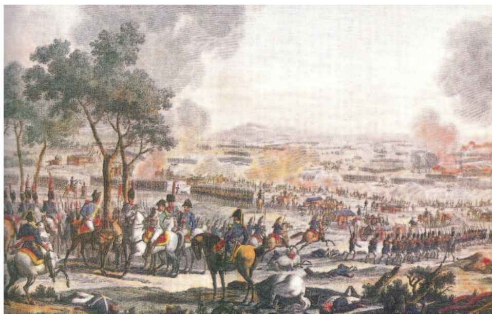
Grabado que muestra el despliegue del ejército francés sobre el Danubio en la batalla de Wagram.

del mariscal Masséna y la artillería apostada en grandes baterías dentro de la isla detuvieron el avance enemigo, logrando golpear las unidades del mariscal Davout el flanco izquierdo austríaco. El ataque decisivo, liderado por el general Macdonald, se desencadenó contra el centro austríaco, logrando romper las líneas del archiduque Carlos, ganando la batalla para Napoleón. Al comenzar la tarde, las fuerzas austríacas comenzaron a retirarse, de forma organizada de tal manera que lograron tomar incluso algunos cañones franceses, pero con la clara sensación de fracaso. Las dispersas fuerzas del archiduque Juan llegaron a conectar con ellas a las 4 de la tarde, pero ya era tarde para las banderas de los Habsburgo. El general Macdonald logró el ansiado bastón de mariscal por méritos en combate, a pesar de que lo hizo sobre un mar de cadáveres. Entre muertos y heridos, 80.000 hombres de ambos ejércitos yacían como consecuencia de la batalla. La derrota de Austria era definitiva y cuatro días más tarde solicitó la paz. Sin embargo, para Napoleón no había sido un buen día: no había conocido tantos prisioneros, ni banderas capturadas ni cañones perdidos.