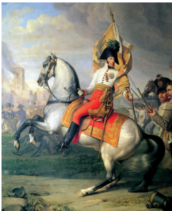
El archiduque Carlos de Habsburgo en la batalla de Aspern-Leising, victoria austriaca sobre los ejércitos napoleónicos, por Johann P. Krafft.

y se alejó de su esposa. En enero de 1810, un tribunal parisino anuló su matrimonio eclesiástico, sin consultar al Papa. Al mes siguiente, la corte de Viena aceptó la petición de mano de la archiduquesa María Luisa de Habsburgo. La segunda esposa de Napoleón no era bella ni tenía una apasionante personalidad, pero poseía aquello que era importante: juventud, salud y unas abuelas que habían tenido dieciocho y veintidós hijos.