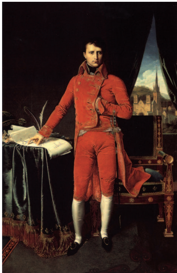
El general Bonaparte, vestido con uniforme de Primer Cónsul de la República Francesa.

Los españoles lograron apoderarse de la flota francesa anclada en Cádiz y