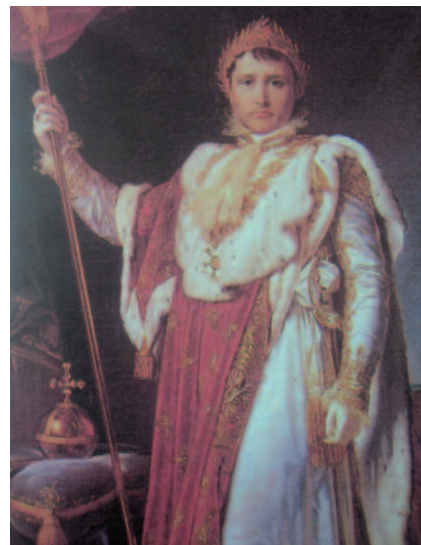
Retrato de Napoleón I, emperador de los franceses, por Gérard.

La opinión pública francesa estaba preocupada y Napoleón volvió a prometer que no habría más guerras. Pero la rebelión de los pueblos contra el César no parecía tener límites. En el reino de Prusia, profesores y estudiantes incitaban al país a luchar por la liberación. La emperatriz de Austria bordaba las enseñanzas que sus tropas lucirían en sus batallas contra el Amo de Europa. Inglaterra envió ayuda económica y el zar, secretamente, sus buenos deseos. Para colmo de males, los católicos estaban muy disgustados con el tratamiento que el emperador estaba dando a Pío VII. Los Estados Pontificios habían sido invadidos por