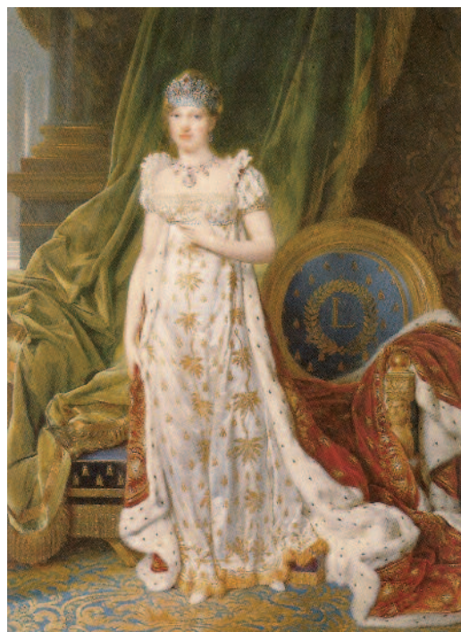
La emperatriz María Luisa de Habsburgo. Tras la victoria sobre el Imperio Austriaco, Napoleón decidió divorciarse de Josefina y contraer nuevo matrimonio con la hija del derrotado emperador Francisco I.