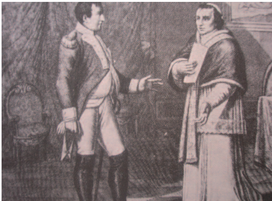
Napoleón y Pío VII, el águila y el cautivo. Grabado de la época.

nar legítima y válidamente su iglesia. El Estado debía, pues, o dejar las sedes sin titulares o instalar allí obispos sin jurisdicción.