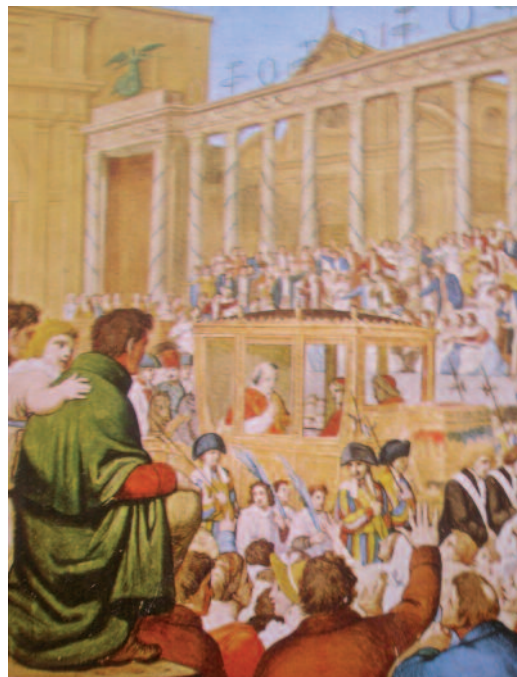
Entrada triunfal de Pío VII en Roma en 1814, tras haber pasado 7 años prisionero de Napoleón.

En las ciudades británicas, crecieron las manufacturas de algodón, donde trabajaban mujeres y niños en duras condiciones laborales. Los obreros se codeaban diariamente con el carbón y el hierro, material que acabaría por transformar el mundo. De su matrimonio, nacería una hija: la máquina de vapor, que revolucionaría, con el tiempo, todos los sistemas mecánicos, tanto de trabajo como de transporte, ayudando como ningún otro ingenio humano al trabajo del hombre. En 1805 se botó al agua el primer barco de vapor. Al año siguiente, se instaló en Manchester la primera fábrica movida por máquinas de vapor. En 1810 había ya en Gran