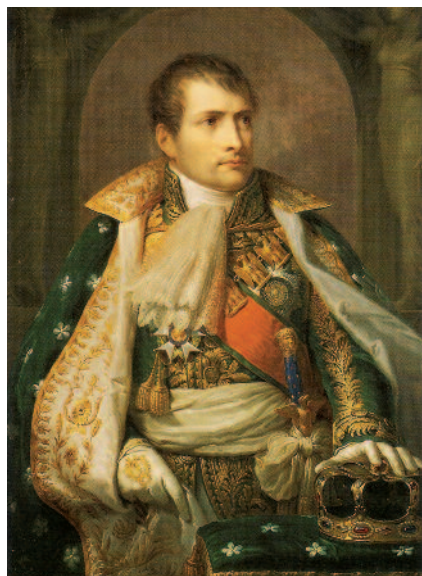
Napoleón I como rey de Italia por Andrea Appiani. La conquista de la Península Itálica a finales del siglo XVIII fue la campaña que inició el brillante curriculum militar del general Bonaparte, el cual llegaría a proclamarse monarca de una Italia unida.

Napoleón siguió el esquema de los generales revolucionarios a la hora de aprovechar el patriotismo y el número de los soldados. En esto no aportó ninguna novedad. Sí que lo hizo al aumentar la movilidad de sus formaciones en el campo de batalla. Bonaparte distribuía sus tropas, alejadas a veces unas de otras, en forma de red, de modo que en el momento oportuno todas podían concentrarse en un punto concreto, por lo general el flanco más débil del enemigo, para lanzarse en tromba. Primero abrían el fuego los fusileros, pero por líneas –como antes– sino a discreción, lo que desordenaba las formaciones enemigas. Luego, la artillería –dispersa también por el campo de batalla– se concentraba rápidamente en el mismo punto gracias a un sistema de vehículos y masacraba las líneas enemigas. Napoleón llegó a concentrar en un mismo lugar el fuego en masa de 200 cañones. Justo después lanzaba la caballería pesada, que rompía las líneas rivales y abría paso a los infantes. Y éstos llegaban en oleadas, no en línea, sino en columnas de cuarenta hombres. El enemi-