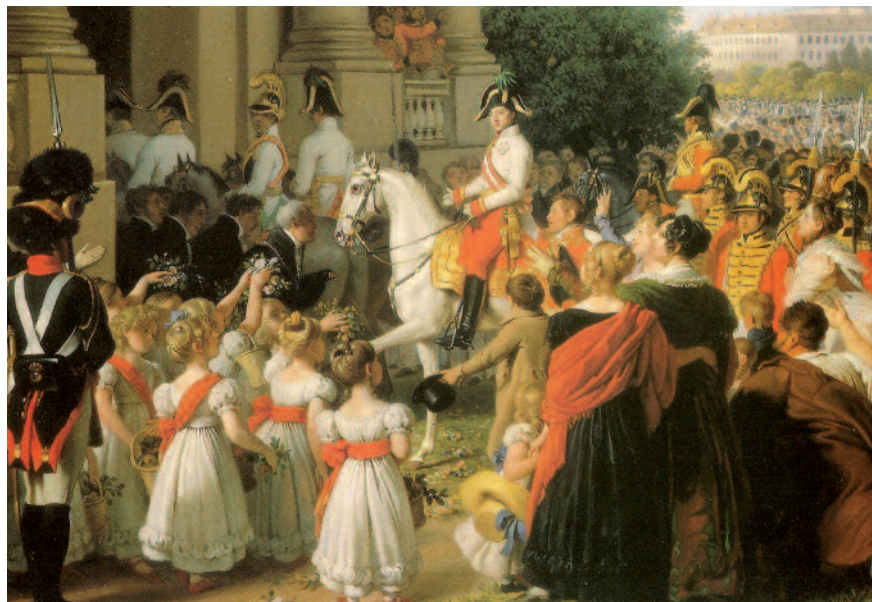
Entrada del emperador Francisco I de Austria en París por J. Krafft. Los aliados europeos lograron vencer a Napoleón y destruir el sueño de su Imperio, de tal manera que el monarca derrotado en Austerlitz y Wagram entró triunfante en la capital francesa años más tarde.

La dirección de la batalla por Napoleón demostró las mismas cualidades que su plan de campaña. Los aliados tenían muy pocas probabilidades, incluso antes de que se disparase el primer cañonazo; sucumbieron a un insidioso espejismo y se lanzaron al ataque sobre un enemigo que creían al borde del colapso. A su magistral plan de engaño, Napoleón añadió un formidable esquema táctico, basado en la concentración de fuerzas en un punto decisivo, que rápidamente desordenó por completo la maquinaria aliada. Los aliados no previnieron ninguna medida de defensa contra un posible ataque francés en el Pratzen y las fuerzas que comprometieron en el sur no supieron moverse en un terreno pantanoso y abrupto. Ade-