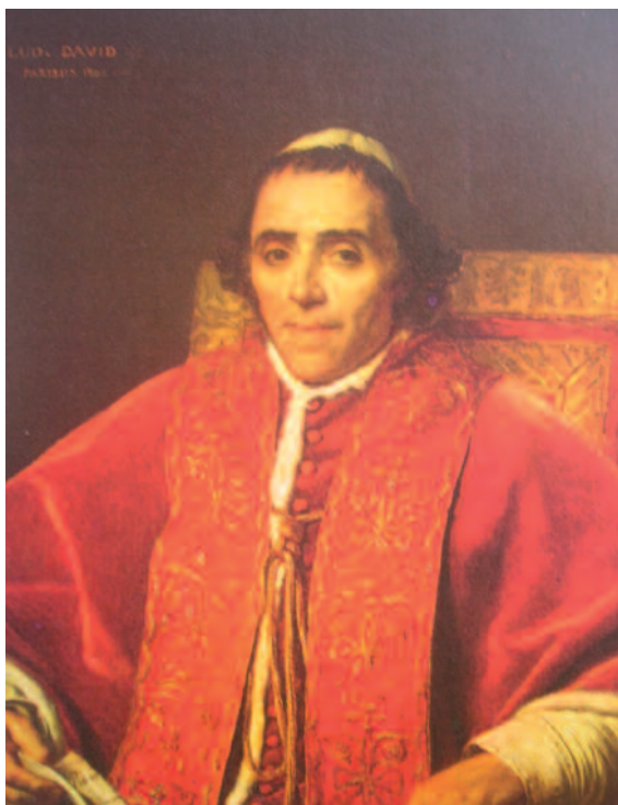
Retrato del papa Pío VII por el pintor revolucionario David, realizado durante la estancia del pontífice en París en 1804.

Las órdenes ¿quién las dictó? En sus Memoorias de Santa Elena , ya en el exilio, Napoleón se exculpó del hecho, argumentando que se le presentaron los hechos consumados. Una carta personal dirigida a su ministro Fouché parece confirmar este punto: « Estoy disgustado de que se haya arrestado al Papa; es una locura. Era necesario arrestar al cardenal Pacca y dejar al Papa tranquilo en Roma. Ahora no hay remedio; lo hecho, hecho está ». ¿Quiso el Emperador engañar y hacer recaer sobre sus subalternos la responsabilidad de semejante medida, negando sus verdaderas instrucciones? Algunos historiadores así lo afirman, pues el César corso había escrito a Murat —mariscal reconvertido en rey de Nápoles tras la marcha de José Bonaparte a España—, con fecha 15 de junio de