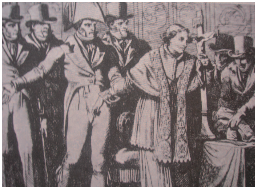
Grabado representando el 5 de julio de 1809, cuando los mandos franceses arrestaron al Papa.

Después de cuarenta y dos días, casi ininterrumpidos, de viaje, el Papa llegó a la ciudad el 6 de julio de 1809, donde permaneció hasta el 9 de junio de 1811, en que fue trasladado a Fontainebleau. En un primer momento, se le alojó en la casa del alcalde, para posteriormente llevarle al obispado, donde fueron llegando algunos sirvientes. Las órdenes de Napoleón pasaban por disimular en lo posible la situación de Pío VII, proporcionándole ciertas comodidades y haciendo ver que su escolta era más una guardia de honor que una tropa de vigilancia. Sin embargo, el Papa se comportó como un prisionero, rehusando todo paseo, afirmando que, de subirse a un coche, sería para volver a Roma. También se negó a recibir una pensión, limitando sus gastos a un régimen monástico, lo que le recordó sus tiempos de juventud. Así, volvió a remendar él mismo sus hábitos, cosiendo sus botones, lavando su sotana manchada por el rapé que consumía en abundancia para calmar sus nervios. Mientras tanto, los días transcurrieron en medio de la oración y la lectura, volviendo a ser, según sus propias palabras, otra vez un pobre monje.